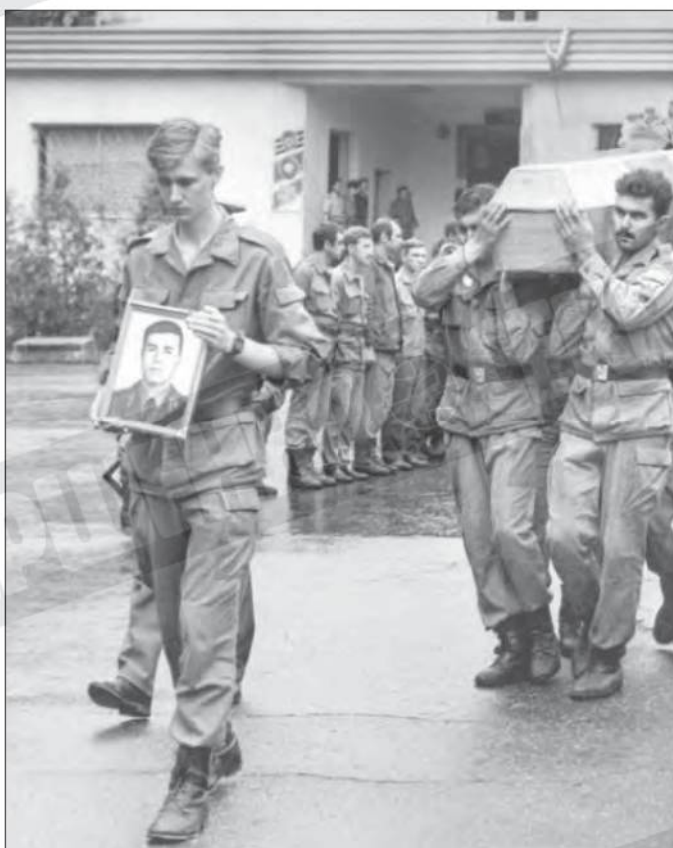
Проводы погибших российских солдат танкового полка в Гори

Испокон веков Кавказ был местом, куда ссылали инуюмыслящих, представлявших угрозу для властей держащих. В офицерской среде аббревиатура ЗакВО расшифровывалась мрачно: «Забудь, как выбраться отсюда». Не миновала эта участь и меня – в декабре 1989 года я был отправлен на должность старшего офицера разведгруппы 19-й отдельной армии ПВО, штаб которой находился в Тбилиси (Грузия). Причина ссылки была банальной: я выступил на партийном собрании и опубликовал несколько статей о коррупции командования своего соединения. Просто надоело жить в условиях полного маразма – с трибуны верха призывали народ к одному, а сами